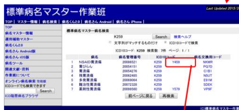
WEBアプリケーションへの組み込み