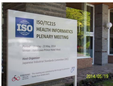
会議会場（軽井沢プリンスホテルウエスト）

ISO/TC215技術委員会会議を日本に招致し、2014年5月19日から23日にかけて長野県軽井沢町で開催した。TC215は、Health Informatics（保健医療情報）分野における国際標準規格について議論する委員会で、年に2回、国際会議が開催されている。委員会事務局（米国診療情報管理学会：AHIMA）と協調しながら会議の準備・運営にあたった。会議には19か国から129名が参加した。